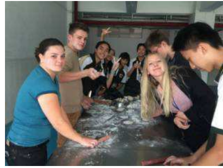
中德师生一起包饺子