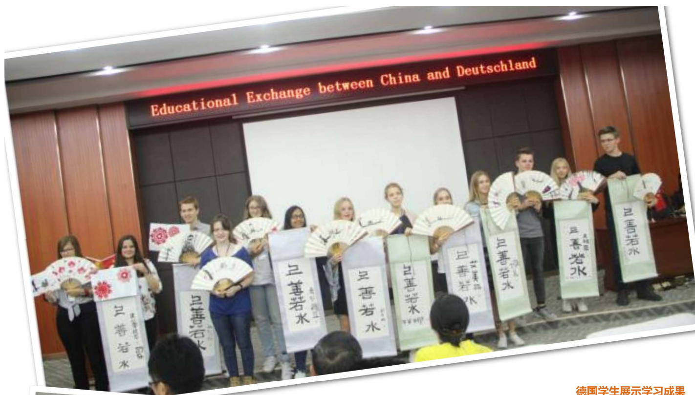
德国学生展示学习成果