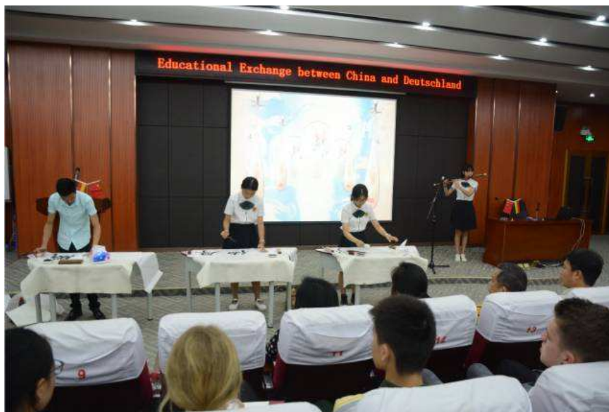
我校师生的笛子演奏及书法展演